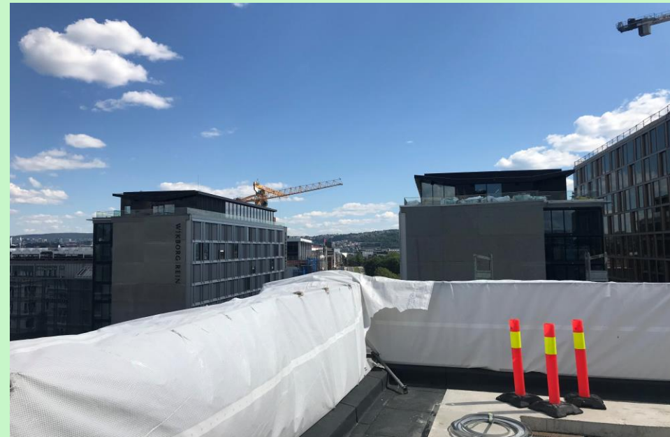
Skolen sett fra Vikaterrassen