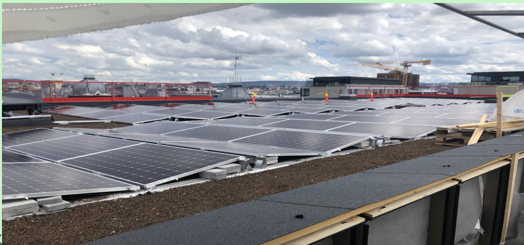
Solcellepaneler på taket