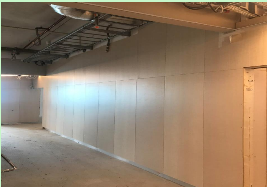
Flotte innervegger i hvitpigmentert slitesterk ask.